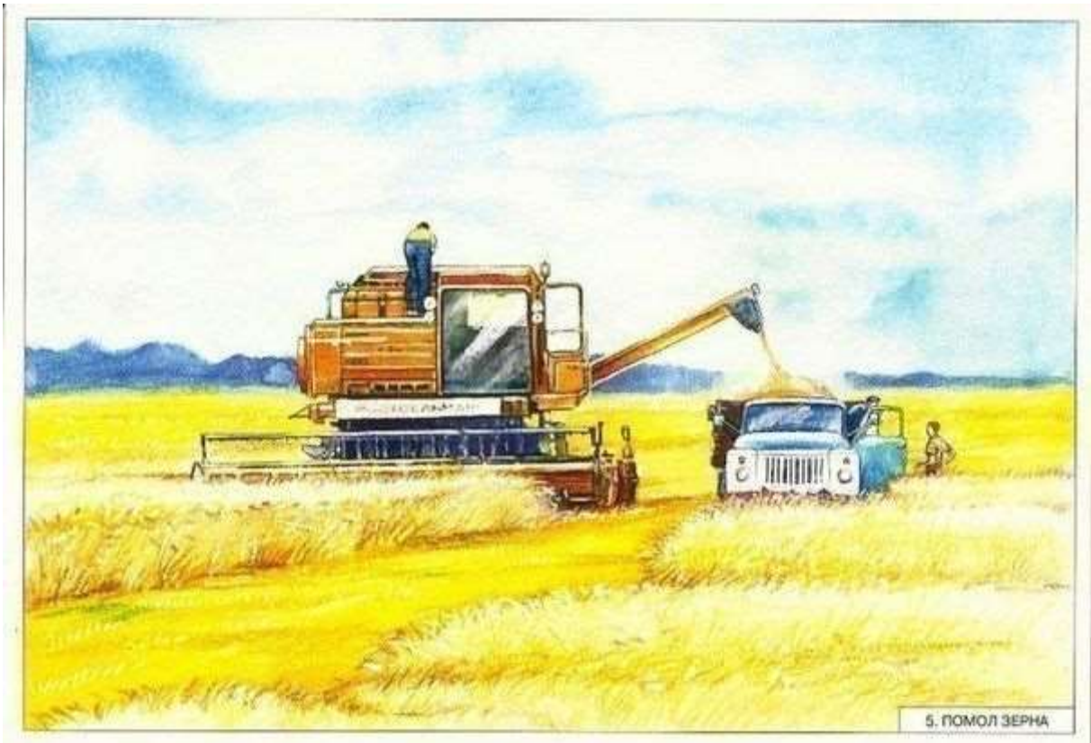
5. ПОМОЛ ЗЕРНА