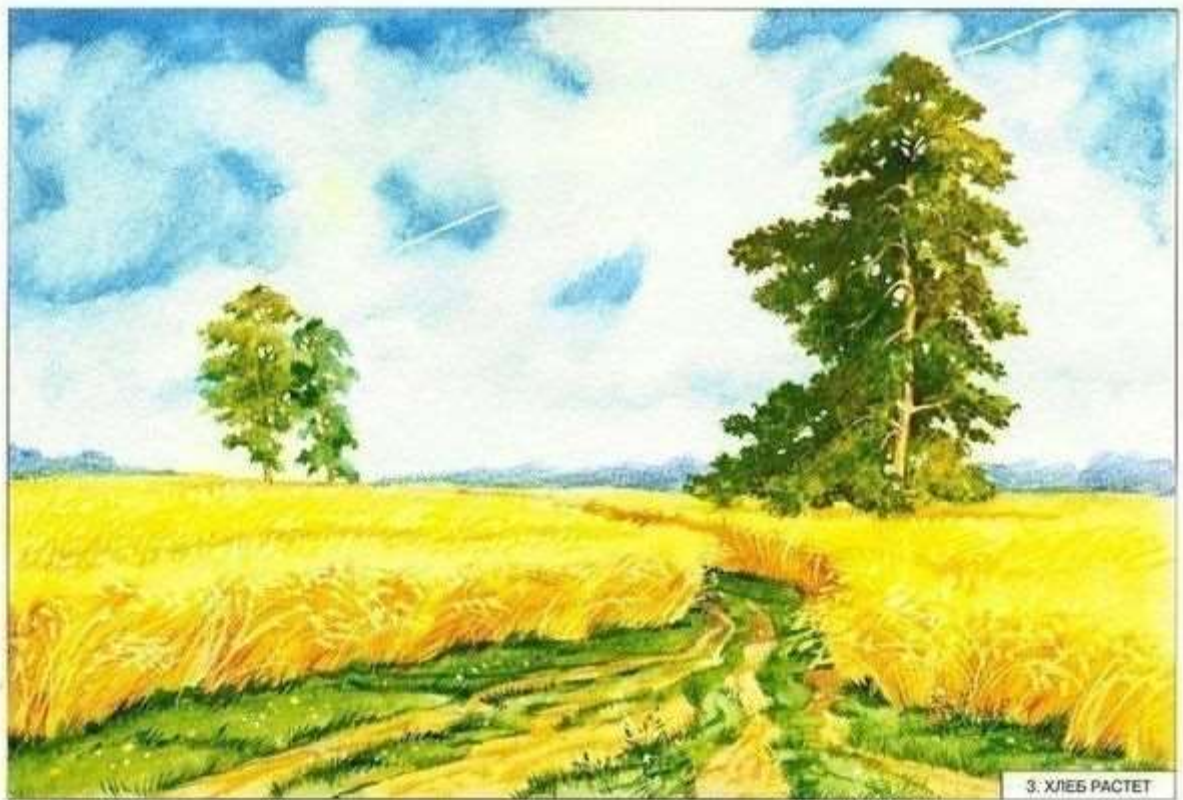
3. ХЛЕБ РАСТЕТ